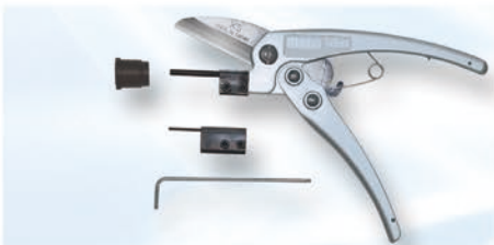
捻じ込み取替え方式 ピンφ4mm・φ2mmセット付