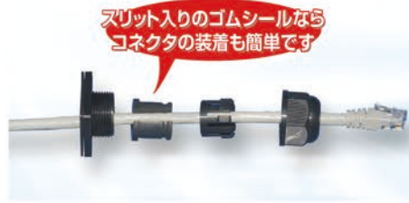
コネクタ頭部が大きくシールを貫通できない場合シールカッターでシール側面を切断。スリット状の側面から電線を横挿入することで簡単に装着可能。